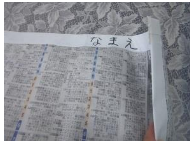
④ 名前を大きく書いてください。