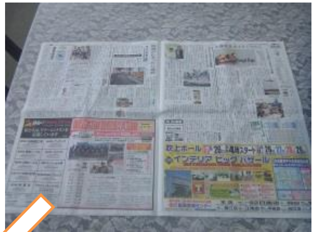
② 新聞紙を広げます。