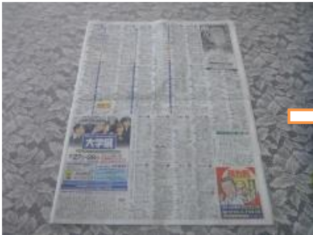
① 新聞紙1日分を用意します。

図工の授業で机が汚れないようにマットを使用したいと思います。お手数をおかけしますが、作成をお願いします。