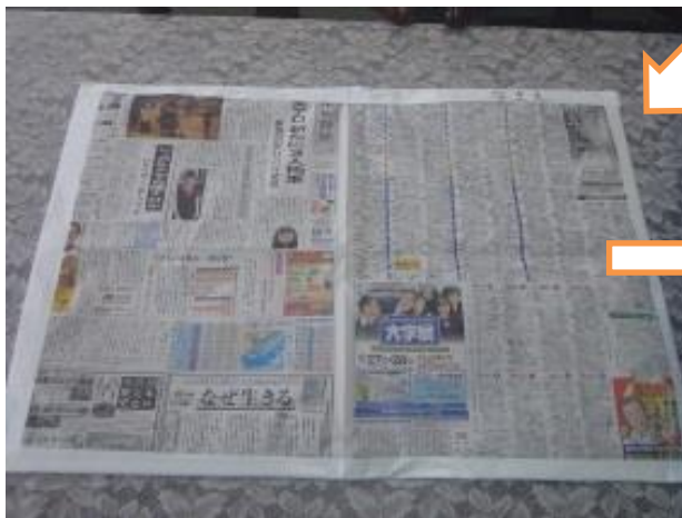
③ 新聞紙の周りを、ガムテープや幅の広いテープで囲いながら、バラバラにならないように、留めます。